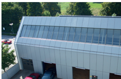
Après Esthétique et protection pour les vingt prochaines années

Prétraitement: premier lavage des façades à l'éponge et à la brosse pour éliminer au mieux les dépôts verts, puis rinçage des surfaces à l'eau et nettoyage au moyen de Qualiprotec Reiniger Abrasiv B, suivi d'un deuxième nettoyage avec des tampons à main blancs en recourant au produit Qualiprotec Reiniger N. Dernier rinçage des éléments de façade au nettoyeur à haute pression, épongeage, séchage et séchage des rainures et des arêtes à l'air comprimé.