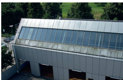
Avant Une façade terne et couverte de mousses

Datant d'une vingtaine d'années, la façade en aluminium était dégradée. Des algues et des lichens ont proliféré sur les façades nord et ouest, et la peinture du toit était usée et détériorée.